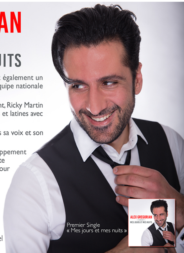
Premier Single « Mes jours et mes nuits »